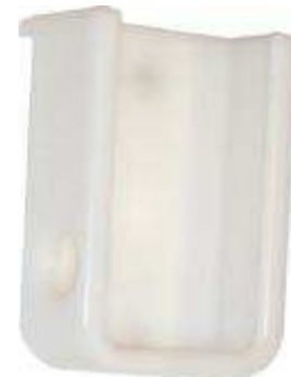
Zidni držač sa mogućnošću zaključavanja