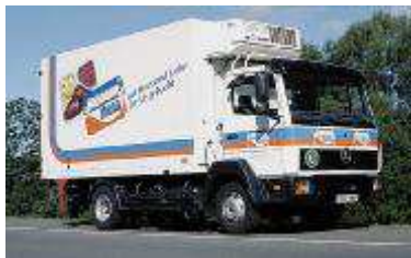
Nadzor u transportu