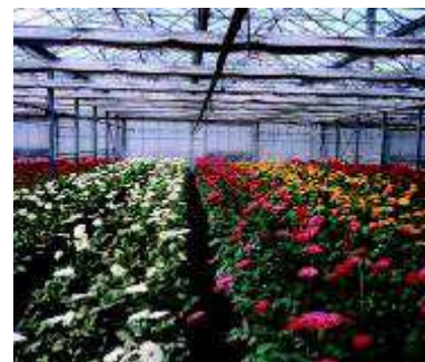
Nadzor u staklenicima