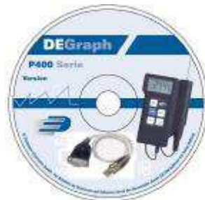
Software & USB-kabal