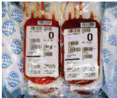
Nadzor krvnih konzervi