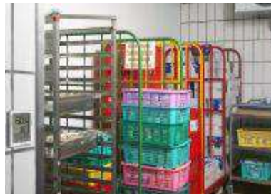
Nadzor u skladištu