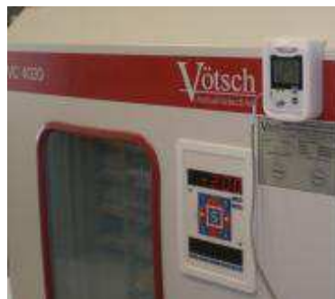
Nadzor u inkubatorima