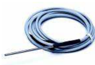
Externi senzor za temperaturu